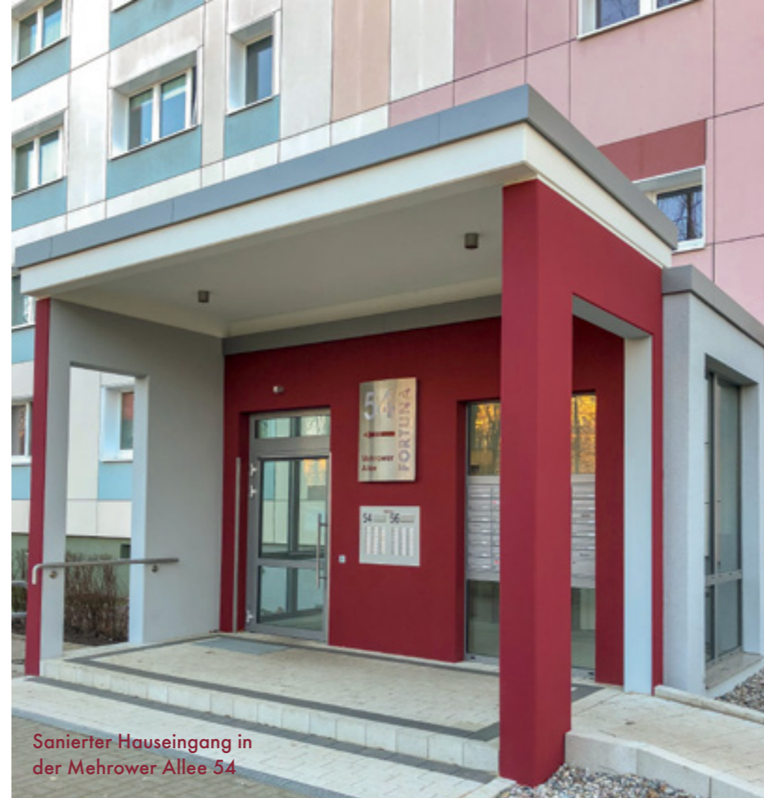
Sanierter Hauseingang in der Mehrower Allee 54

die Gestaltung von Eingangsbereichen, Wegen und Plätzen sowie die Umsetzung von Beleuchtungskonzepten im Wohngebiet. Bezüglich des Brandschutzes erfolgt neben den laufenden Ertüchtigungen innerhalb der Wohngebäude im Jahr 2019 die Installation von Rauchmeldern im gesamten Wohnungsbestand. Die FORTUNA wird das Handlungsfeld der Mobilität unter der Prämisse der Wirtschaftlichkeit aktiv vorantreiben und unter Nutzung der Standorte und politischer Förderungen ihren Beitrag zur Erfüllung der Umweltziele und zur Stabilisierung und Revitalisierung der Quartiere leisten. Aktuell wird in Abstimmung mit der Immobilienverwaltung der Bedarf an Fahrrad- und Rollatorenstellplätzen verifiziert. Im Anschluss daran werden entsprechend den Örtlichkeiten Maßnahmen für eine verkehrssichere und ausreichende Unterstellmöglichkeit erarbeitet.