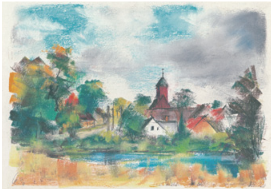
Abbildung aus dem Buch „Märkische Dorfkirchen“ von Franz Ehmke

Dorfkirche in Krewelin: Der kleine Fachwerkbau mit einem südlichen Anbau und hölzernem Dachreiter stammt aus dem Jahre 1694.