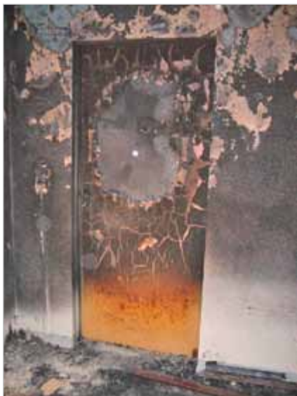
Wohnungstür in unmittelbarer Nähe des Brandes

Zum Glück für alle Mieter funktionierten die in den Häusern der Genossenschaft vorhandenen brandtechnischen Einrichtungen und Anlagen einwandfrei. Die Feuerwehr war innerhalb kürzester Zeit zur Stelle und so konnte Schlimmeres verhindert werden. Durch die vorhandenen Trockensteigleitungen musste die Feuerwehr nicht erst die Schläuche durch das Treppenhaus verlegen, sondern konnte sofort in der in Brand geratenen Etage mit den Löscharbeiten beginnen.