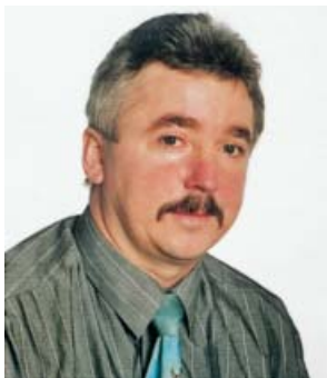
Versicherungsbüro Werner Döffinger