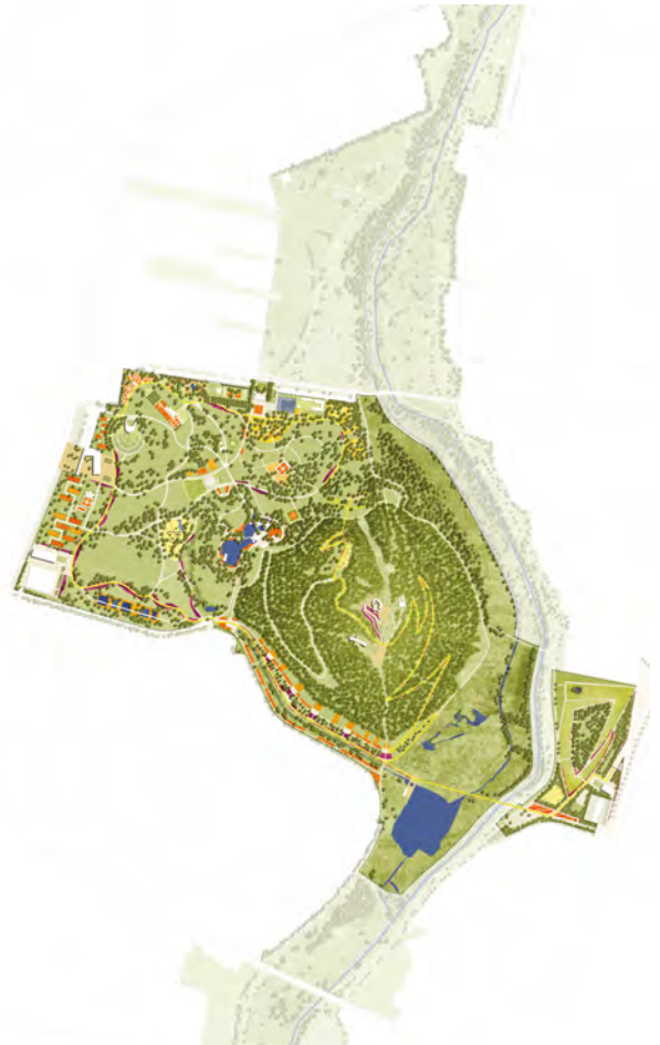
© oben und links: geskes.hack Landschaftsarchitekten, VIC Brücken und Ingenieurbau, Kolb Ripke Architekten

Ein großer Teil der erwarteten 2,4 Millionen Gäste wird mit der Seilbahn die Gartenausstellung erreichen – Berlins erste Seilbahn seit knapp sechs Jahrzehnten. Nicht nur Berlins neue Seilbahn wird Marzahn-Hellersdorf zu einem touristischen Anziehungspunkt machen, sondern auch das spektakuläre Aussichtsbauwerk, das auf dem Kienberg entsteht. Beide Projekte bleiben Berlin und dem Bezirk über die IGA Berlin 2017 hinaus als Attraktionen erhalten.