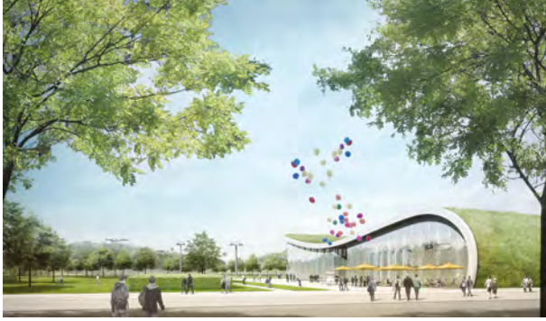
© LEITNER ropeways, KOLB RIPKE Architekten